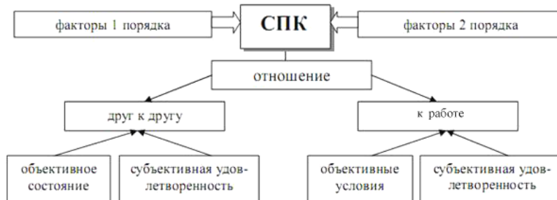
Рис. 3. Структура социально-психологического климата на площадке №8 «Новое поколение»

формирующих отношение к деятельности, – второго порядка.