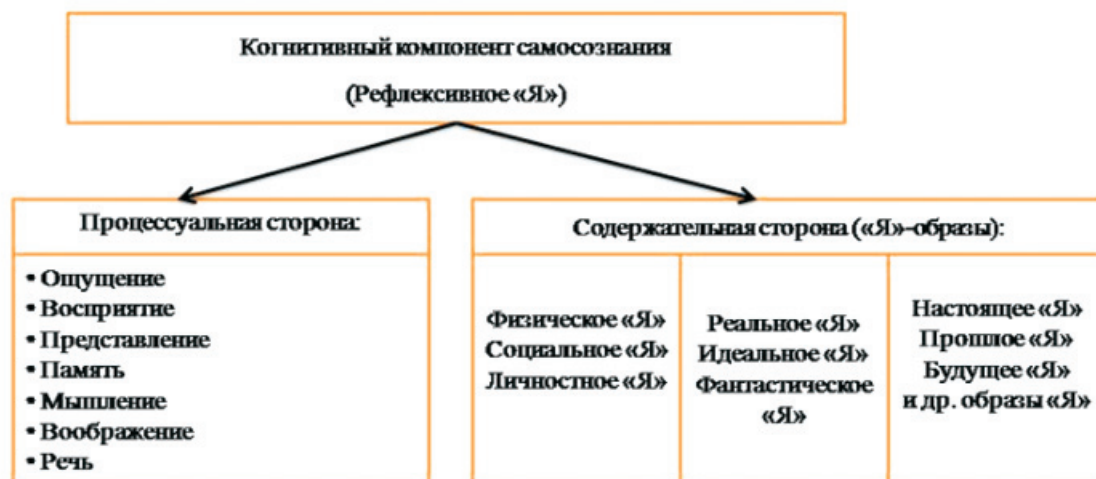
Рис. 1. Структура когнитивного компонента самосознания

му тела [В.В. Столин, 1983; В.В. Иванова, 2002; А.А. Налчаджян, 2010], являющуюся базисом для дальнейшего развития самосознания. Позже человек начинает осознавать и накапливать представления о выполняемых им социальных ролях, о собственных психических процессах, психологических свойствах и чертах, что приводит к формированию социального и личностного «Я»-образов [П.Р. Чамата, 1966; В.В. Столин, 1983; З.В. Диянова, Т.М. Щеголева, 1993].