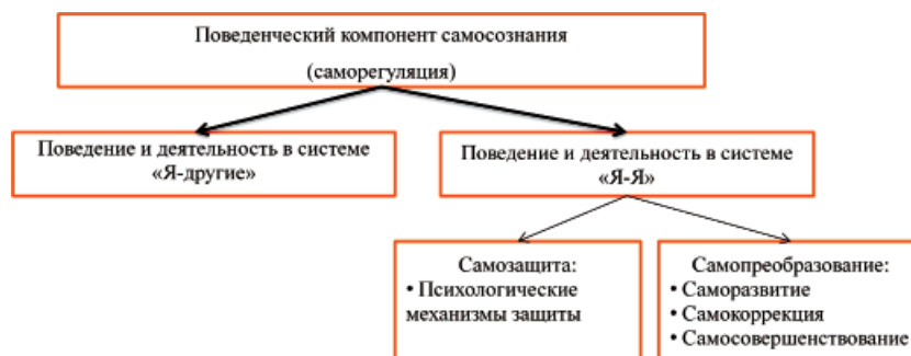
Рис. 4. Структура поведенческого компонента самосознания

Таким образом, поведенческий компонент самосознания складывается из поведения и деятельности, направленных на других людей (в системе «Я-другие»), и поведения и деятельности, направленных на самого себя (в системе «Я-Я») и реализующихся в форме самозащиты или самопреобразования (рис. 4).