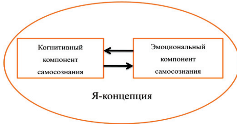
Рис. 3. Структура «Я»-концепции

одной из основных. [...] Однако механизмы связи самосознания с конкретным поведением и деятельностью остаются нераскрытыми» [В.И. Моросанова, Е.А. Аронова, 2007, с. 46–47].